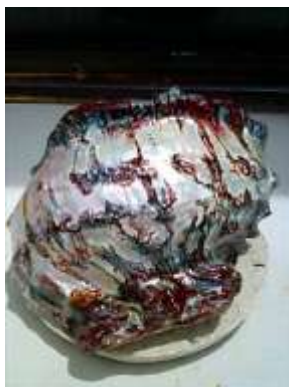
注文品 家のお守り床の間用